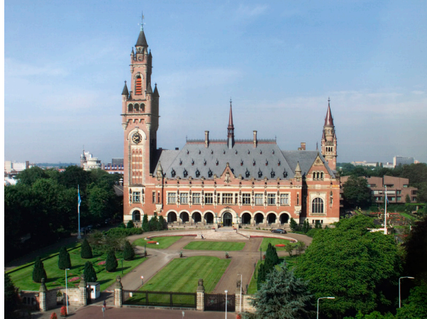
図6: 国際司法裁判所