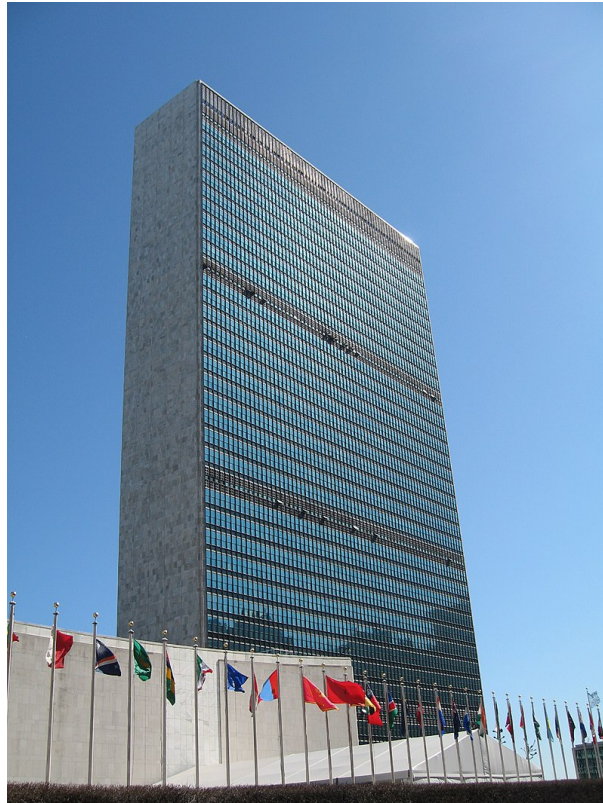
図3: 国際連合本部ビル

国内社会における三権（立法、行政、司法）と比較して、国際社会（特に国際連合）を見てみる。