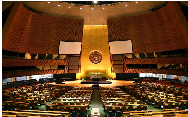
図4: 国連総会本会議場

国際社会の議会に近い存在として国際連合 (the United Nations: UN) の総会 (General Assembly)