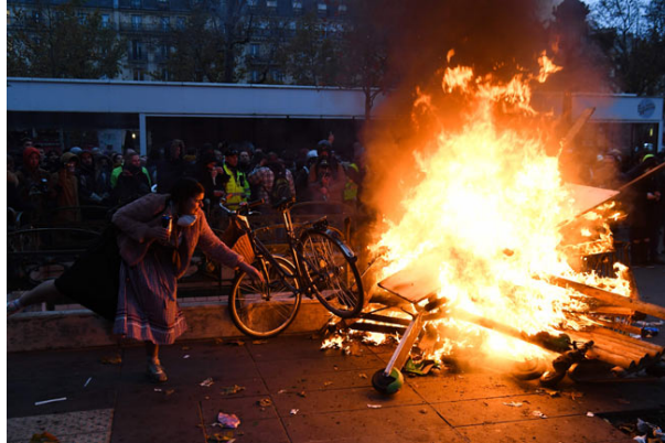
図1: パリで大規模デモ 写真特集