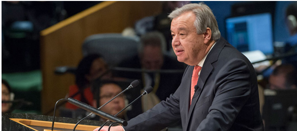
図5: アントニオ・グテーレス国連事務総長